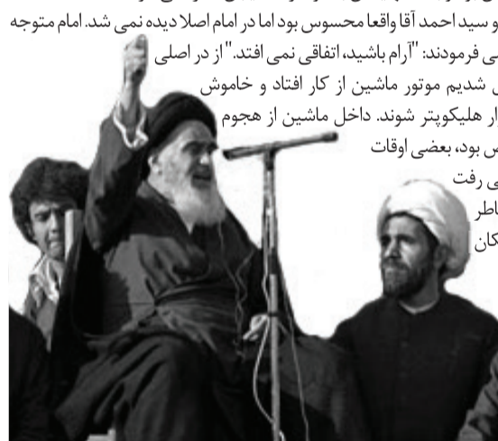
بهشت زهرا که داخل شدیم موتور ماشین از کار افتاد و خاموش شد. قرار شد امام سوار هلیکوپتر شوند. داخل ماشین از هجوم جمعیت زللمات محض بود، بعضی اوقات که پای کسی کنار می‌رفت یک نوری می‌آمد. بخاطر ازدحام جمعیت امکان پیاده شدن امام نبود. اقتباسی از کتاب خاطرات محسن رفیق دوست تحت عنوان "برای تاریخ می‌گویم"

مردم تمام مسیر فرودگاه تا بهشت زهرا را آب و جارو کردند و گل ریختند. هواپیمای امام که نشست قرار نبود کسی روی باند برود. فقط شهید مطهری و آیت‌الله پسنیدیه (برادر امام) داخل هواپیما رفتند و با امام به داخل سالن آمدند. امام چهار پنج دقیقه پیام کوتاهی به مردم دادند و فرمودند: "وعده‌ی ما بهشت زهرا!" زمانی که در تدارک مراسم استقبال از امام بودیم رانندگی ماشین امام به عهده من گذاشته شد. ازدحام زیادی بود، امکان خارج شدن امام از داخل جمعیت نبود. من به حاج احمد آقا (فرزند امام) گفتم که امام را دوباره به باند ببرید تا همان جا سوار ماشین بشوند. همین که به میدان فرودگاه رسیدیم برنامه‌ها به هم خورد، مردم ریختند دور ماشین و فشار جمعیت بین ماشین ما و ماشین‌های اسکورت فاصله انداخت. از ابتدای جاده فرودگاه جمعیت به حدی رسید که به نظر من ماشین به دست مردم به چپ و راست متمایل می‌شد. امام از همان لحظه که حرکت کردیم لیچندی روی لبه‌هایشان بود و با دستهایشان به دو طرف خیابان اشاره می‌کردند. فشار عصبی روی من و سید احمد آقا واقعا محسوس بود اما در امام اصلا دیده نمی‌شد. امام متوجه حال من می‌شدند و می‌فرمودند: "آرام باشید، اتفاقی نمی‌افتد." از در اصلی